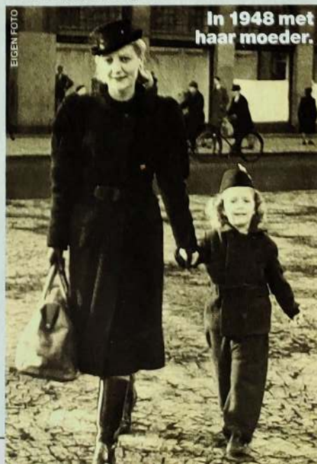
In 1948 met haar moeder.